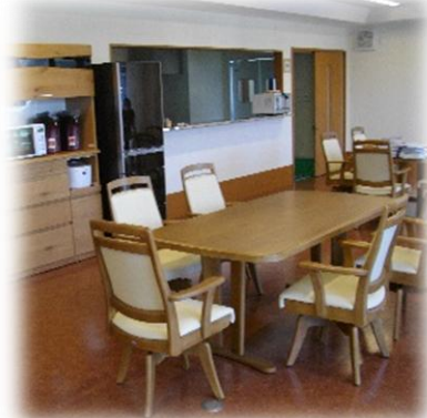
南向きの 明るい談話室です。